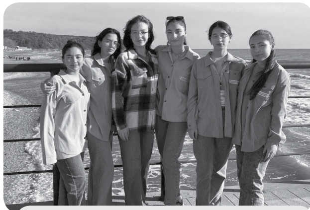
Участники из Предгорья на Всероссийском конкурсе «Территория успеха».

Теперь финалистов ждёт увлекательное и познавательное 21-дневное путешествие, насыщенное и увлекательная программа. Ребята посетят мастер-классы от