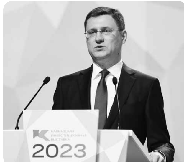
В церемонии открытия инвествыставки принял участие зампред правительства РФ Александр Новак.

– Кавказская инвестиционная выставка – знаковое мероприятие для всей нашей страны, для такого важного региона, как Северо-Кавказский федеральный округ. Уве-