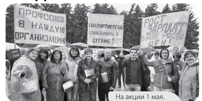
На акции 1 мая.